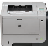
Impresora HP LaserJet empresarial P3015dn