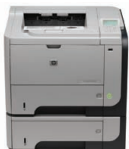
Impresora HP LaserJet empresarial P3015x