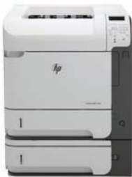
HP LaserJet Enterprise 600 M602x