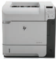
HP LaserJet Enterprise 600 M602dn